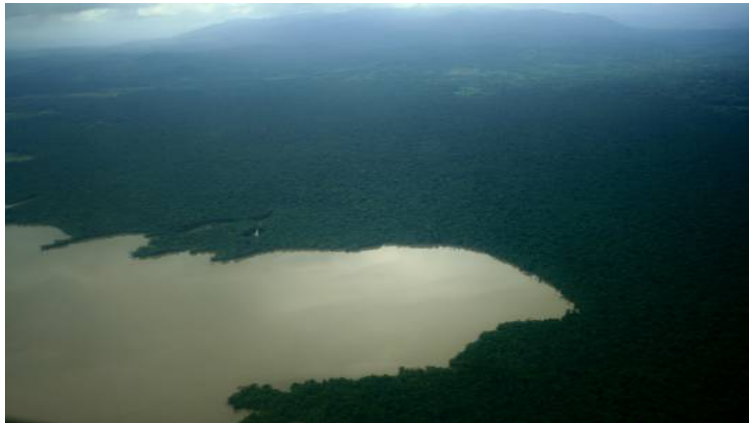
Laguna de Brus

manatíes, nutria, tortugas verdes de mar y caimán. Las áreas de bosque son el hábitat de tapir, jaguar, ocelote, león, yaguarundí, kekeo, jaguilla, mono arana, mono aullador, mono cara blanca, venado cola blanca, oso caballo y perezoso de tres dedos sólo para nombrar algunos.