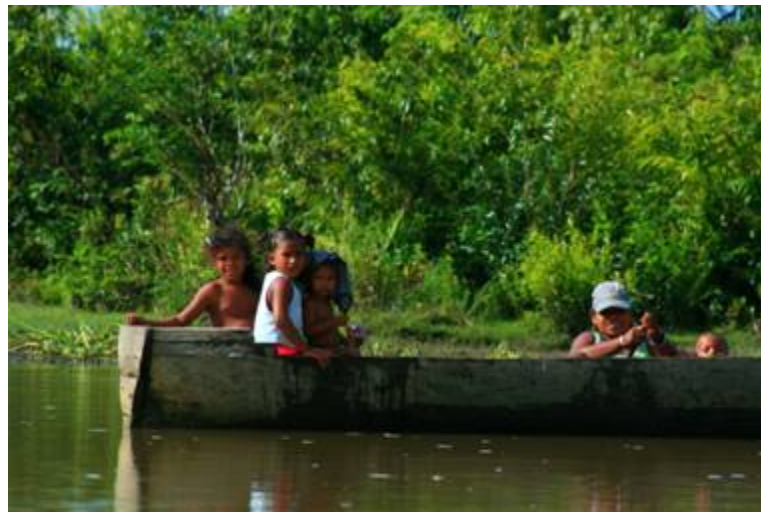
Familia participando en labores de pesca

Cerca del 75% de la biósfera son montañas con muchos rangos de altura. Pico Morrañanga alcanza los 1500 metros y Punta de Piedra 1326 metros. Increíbles formaciones geológicas son encontradas en las regiones de tierra firme, tales como El Viejo o Pico de Dama. y chorros son encontrados regularmente, la más alta (100-150 m) es la Cascada del Mirador en la cabecera del Río Cuyamel. Esta inmensa área consiste principalmente en bosque lluvioso tropical.