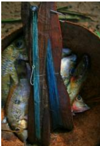
Producto de la pesca