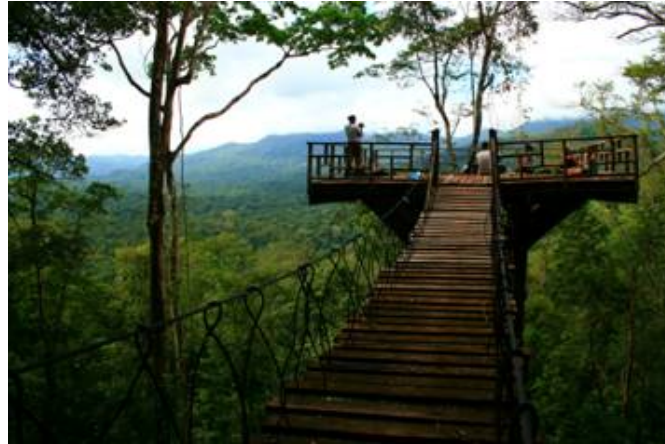
Observatorio de Aves (Aviturismo)

se encuentran a lo largo de la Costa de Brus Laguna (120 km 2 ) y la Laguna de Ibans (63 km 2 ), un gran número de sabanas y humedales se encuentran a todo lo largo del resto de la región.