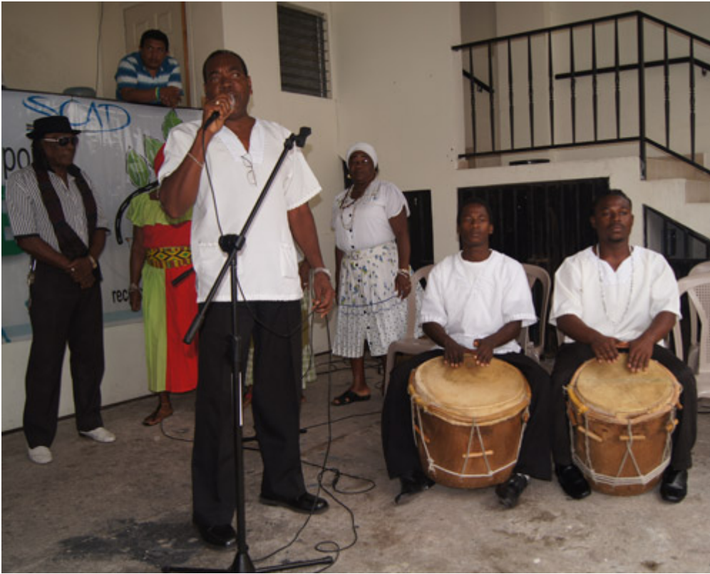
El tambor, uno de los instrumentos garífunas