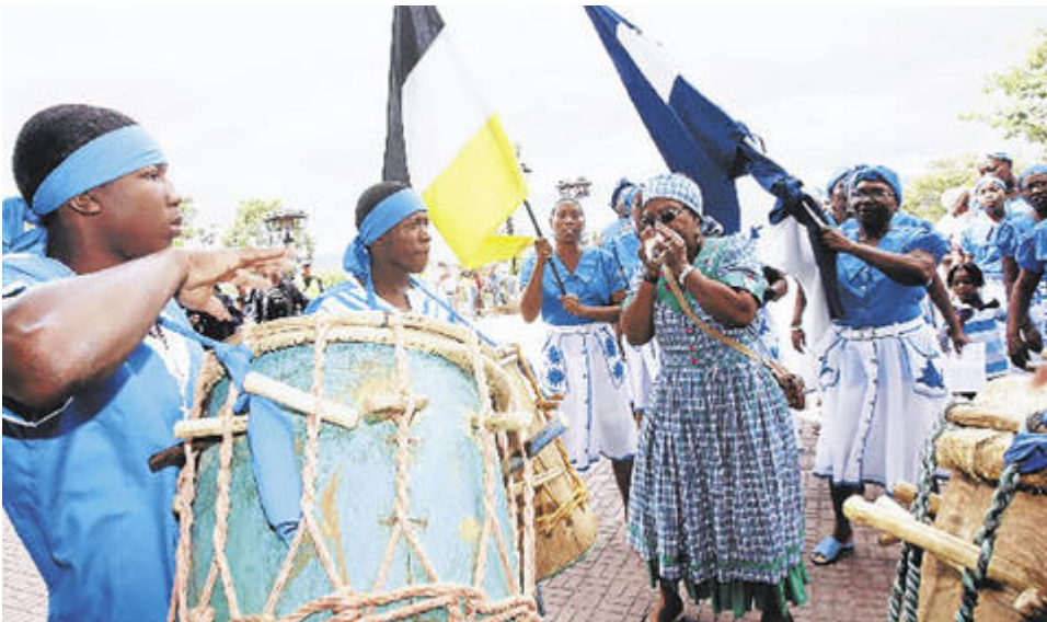
Garífunas bailando punta