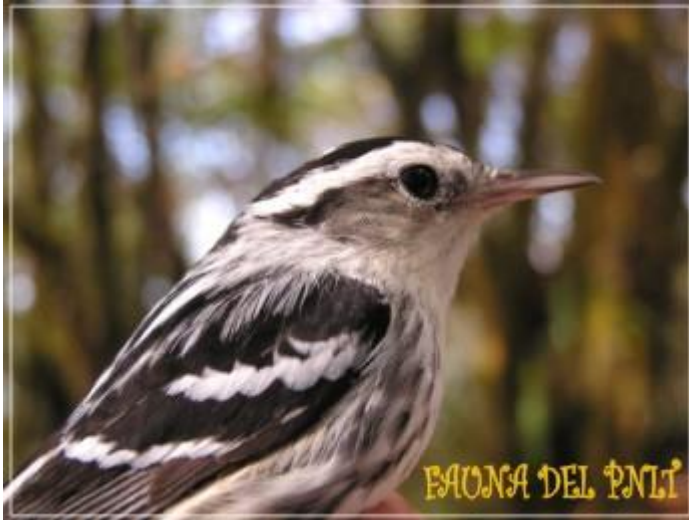
Black and White Warbler

El PNLT es además refugio y hábitat de gran variedad de aves, la mayoría de ellas residentes y alguna migratorias.