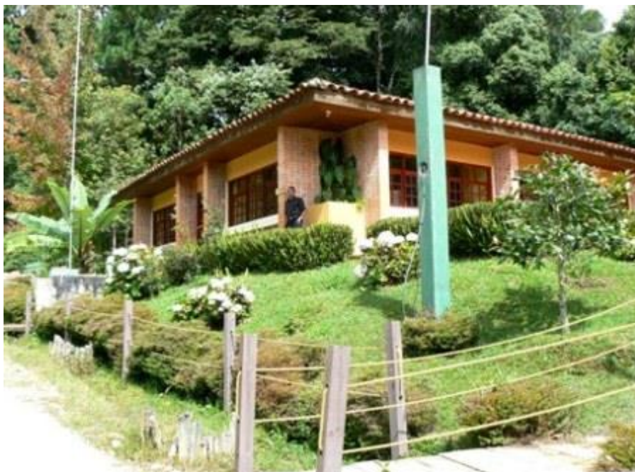
Centro de Visitantes Jutiapa

El centro de visitantes de Jutiapa, es el mas visitado del Parque por su proximidad a la ciudad de Tegucigalpa. Este centro ha sido muy utilizado para charlas ambientales, capacitaciones de los guías y campamentos educativos sobre la conservación del medio ambiente. Este centro de visitantes cuenta con una maqueta en donde se representa en su totalidad a la Montaña de La Tigra y La Montaña de San Juancito, contiene además una colección de insectos, afiches, fotos, y algunos souvenir. También cuenta con una cafetería en donde se pueden adquirir desayunos, frutas, entre otros. Tanto este centro como el de Rosario tienen sus puertas abiertas al publico de 8 a.m. hasta las 2 p.m.