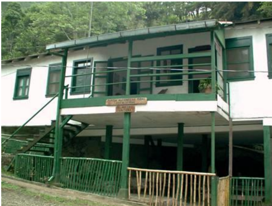
Eco Albergue El Rosario

El Ecoalbergue El Rosario cuenta con instalaciones para alojar hasta 40 personas. También esta a la disposición de los visitantes un cómodo salón para reuniones, retiros, etc. Además cuenta con servicio de cafetería, el cual se le puede proveer comida para usted o para sus reuniones, todo a un bajo costo. Para hacer uso de este salón, por favor comunicarse con las oficinas administrativas con anticipación.