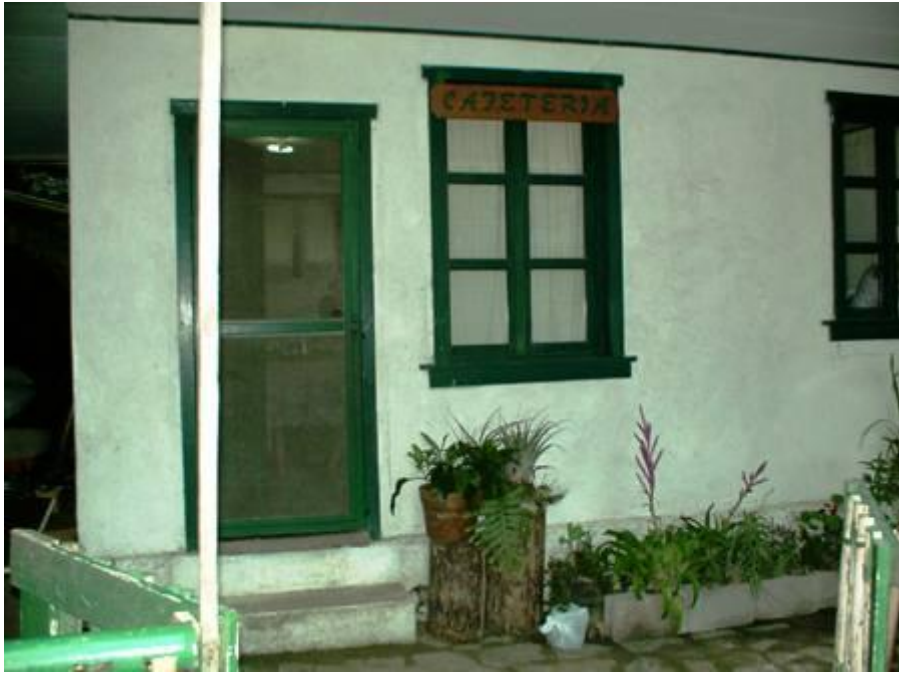
Cafeteria Eco Albergue El Rosario

El centro de visitantes de Jutiapa, es el mas visitado del Parque por su proximidad a la ciudad de Tegucigalpa. Este centro ha sido muy utilizado para charlas ambientales, capacitaciones de los guías y campamentos educativos sobre la conservación del medio ambiente. Este centro de visitantes cuenta con una maqueta en donde se representa en su totalidad a la Montaña de La Tigra y La Montaña de San Juancito, contiene además una colección de insectos, afiches, fotos, y algunos souvenir. También cuenta con una cafetería en donde se pueden adquirir desayunos, frutas, entre otros. Tanto este centro como el de Rosario tienen sus puertas abiertas al publico de 8 a.m. hasta las 2 p.m.